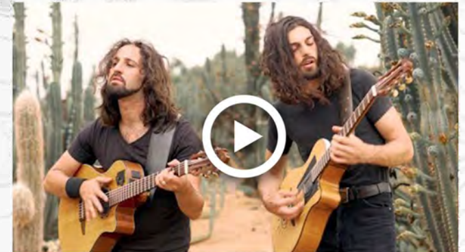
MEXICANA-OFFICIAL MUSIC VIDEO