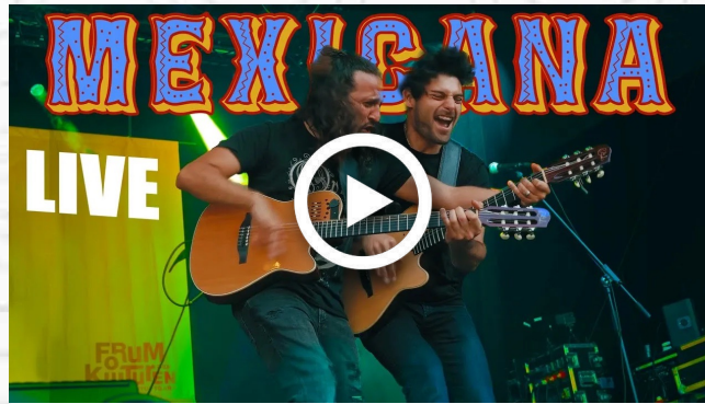
MEXICANA - Live Stuttgart 2023