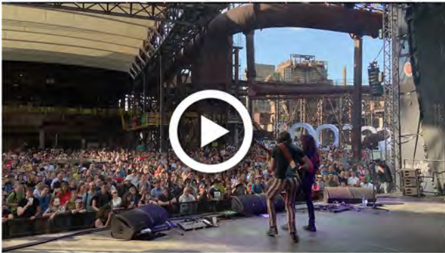
ENDLING - COLOURS OF OSTRAVA 2019