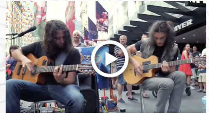
J.A.M -VIRAL BUSKING VIDEO (30M COMBINED VIEWS)