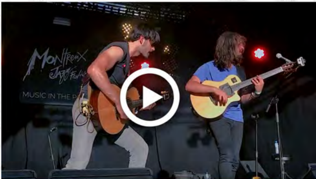
J.A.M- MONTREUX JAZZ FESTIVAL 2018